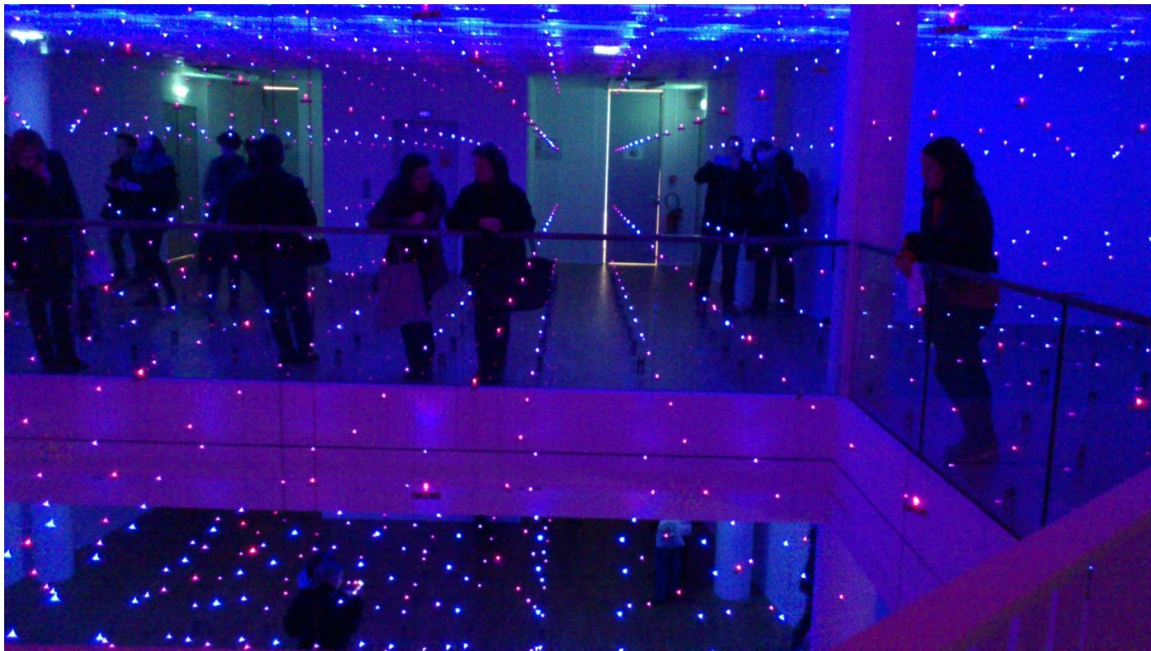
Light Matters, Erwin Redl